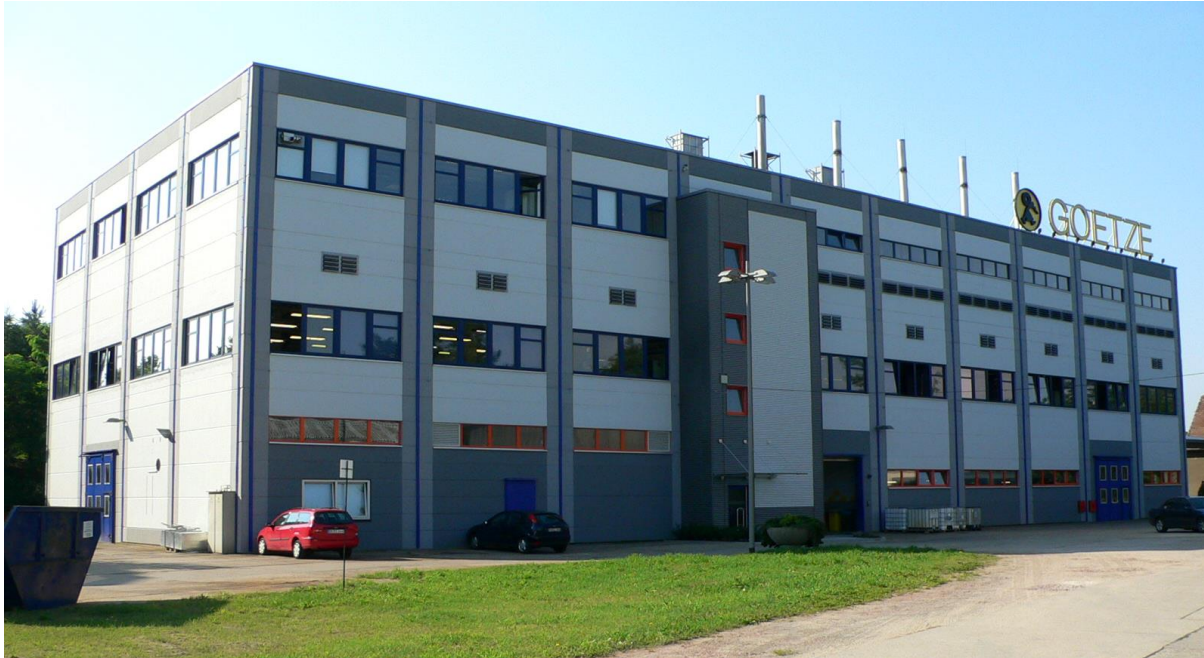
Foto: Federal-Mogul Dresden, Betriebsbereich Galvanik